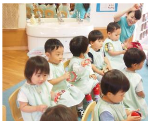
みんなでチャチャチャ♪