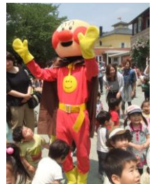
あんばんまん登場！