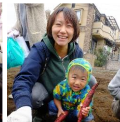
おおきなお芋をほったよ