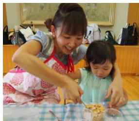
ママとクッキング♡